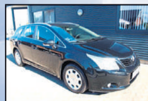
Toyota Avensis 2,0 D-4D TX st. car Årgang: 2010 Km: 112.000 Pris: 169.800,-