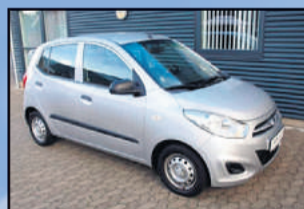
Hyundai i10 1,2 Comfort A/C Årgang: 2012 Km: 24.000 Pris: 69.800,-

"Close to Something Next to Nothing" lyder titlen på dette maleri.