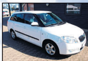
Skoda Fabia 1,4 TDI 80 Greenline Combi Årgang: 2008 Km: 143.000 Pris: 74.800,-

Se flere biler på vores hjemmeside rtkauto.dk