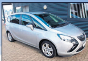
Opel Zafira Tourer 2,0 CDTI Enjoy eco Årgang: 2012 Km: 117.000 Pris: 224.800,-