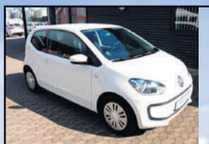
VW Up! 1,0 60 Move Up! BMT Årgang: 2012 Km: 64.000 Pris: 79.800,-