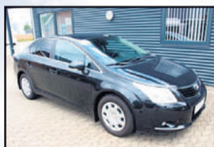
Toyota Avensis 2,0 D-4D T2 Årgang: 2009 Km: 129.000 Pris: 144.800,-